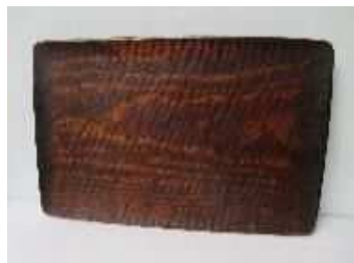
3.小盆 12,000円 横273×縦185×厚20