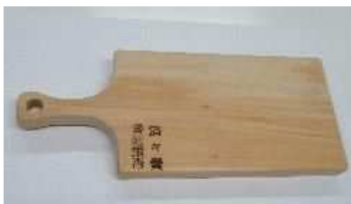
7.まな板(握り付き) 3,000円 本体横250・全体300×縦148×厚23