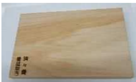
6.まな板 3,000円 横300×縦200×厚23