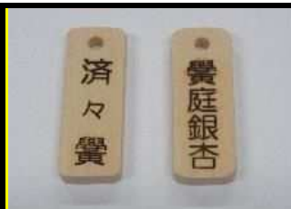
縦70×横25×厚10 (表裏共焼き印)

②表札用板 (最大寸250×150×30内で大きさの指定可能) 価格3,000円から (販売のみ。加工、名入れは致しません。)