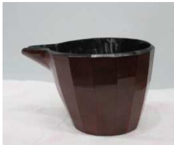
1.片口 35,000円 長径130×短径90×高85