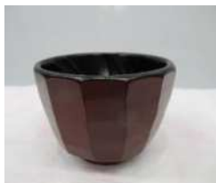
2.ぐい呑み 13,000円 径62×高50